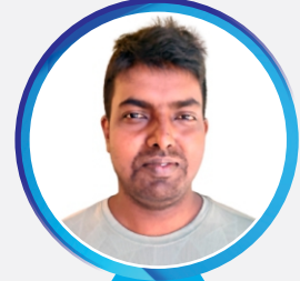
महेन्द्र मण्डल लेखा अधिकृत